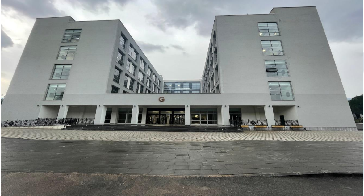
Şekil 2. İnşaatı Tamamlanan Mimar Sinan Yerleşkesi G Blok Eğitim Binası

İnşaatı tamamlanan Mimar Sinan Yerleşkesi G Blok Eğitim Binası yapım işine ait görsel Şekil 2’de verilmiştir.