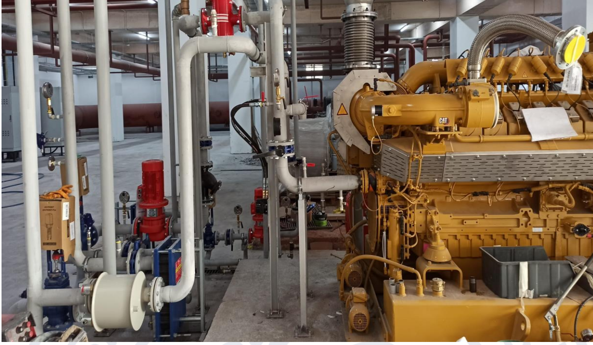
Şekil 3. Mimar Sinan Yerleşkesi 3 Etap Altyapı Elektromekanik Yapım İşi