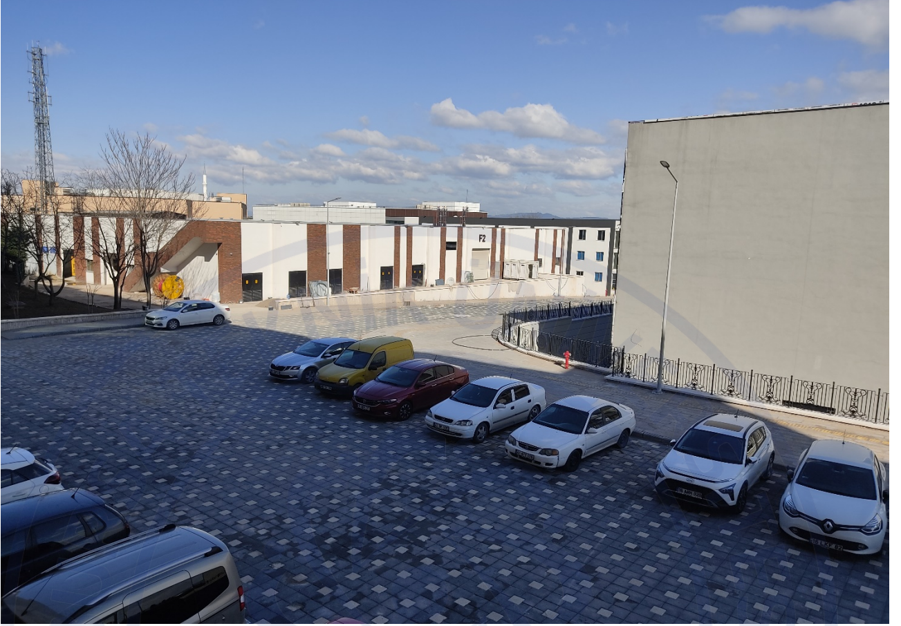
Şekil 3. Tamamlanan Mimar Sinan Yerleşkesi 2.Etap Altyapı Yapım İşi