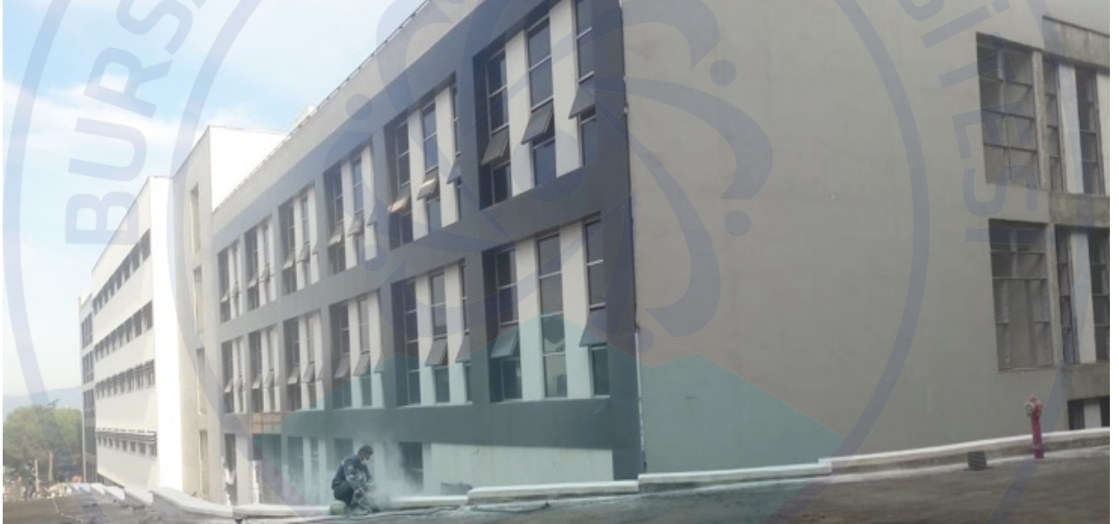
Şekil 2. İnşaatı Devam Eden Mimar Sinan Yerleşkesi G Blok Eğitim Binası

İnşaatı devam eden Mimar Sinan Yerleşkesi G Blok Eğitim Binası yapım işine ait görsel Şekil 2’de verilmiştir.