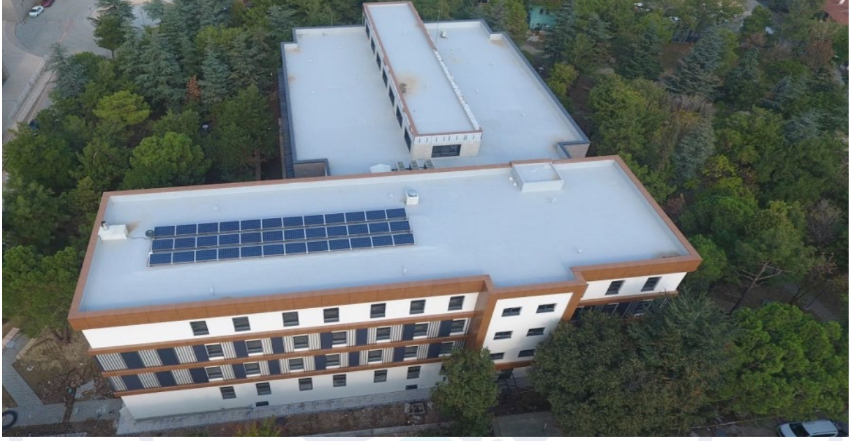
Şekil 2. Tamamlanan YYB B Blok Merkezi Derslik Binası

İnşaatı tamamlanan YYB B Blok Merkezi Derslik Binasına ilişkin görsel Şekil 2’de verilmiştir.