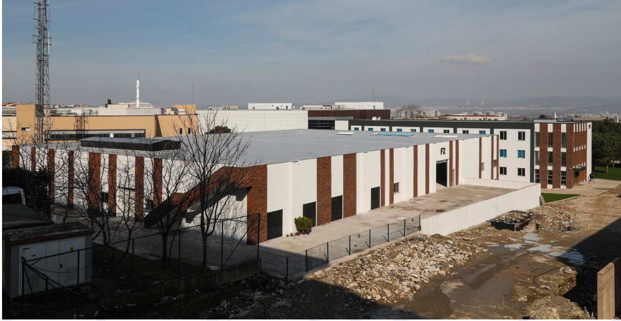
Şekil 4. Tamamlanan MSY 1.Etap Altyapı, Isı Merkezi ve Atölyeler

İnşaatı tamamlanan MSY 1. Etap Altyapı, Isı Merkezi ve Atölyelere ilişkin görsel Şekil 4'te verilmiştir.