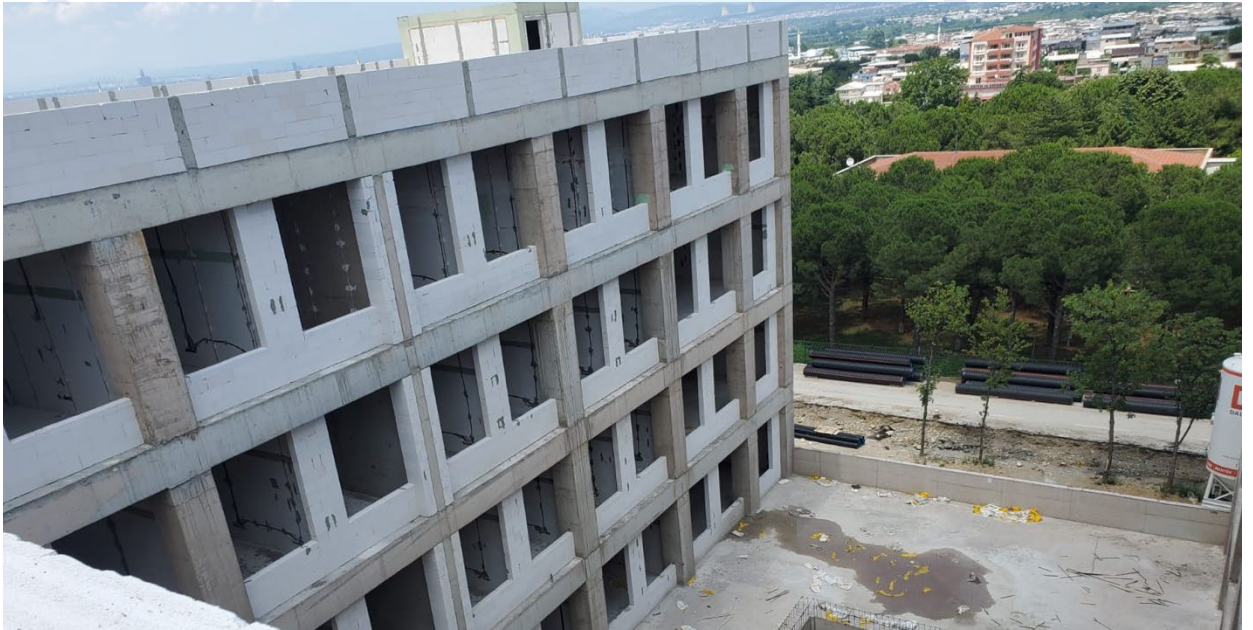
Şekil 3. İnşaatı Devam Eden MSY G Blok Eğitim Binası

İnşaatı devam eden MSY G Blok Eğitim Binasına ilişkin görsel Şekil 3’te verilmiştir.