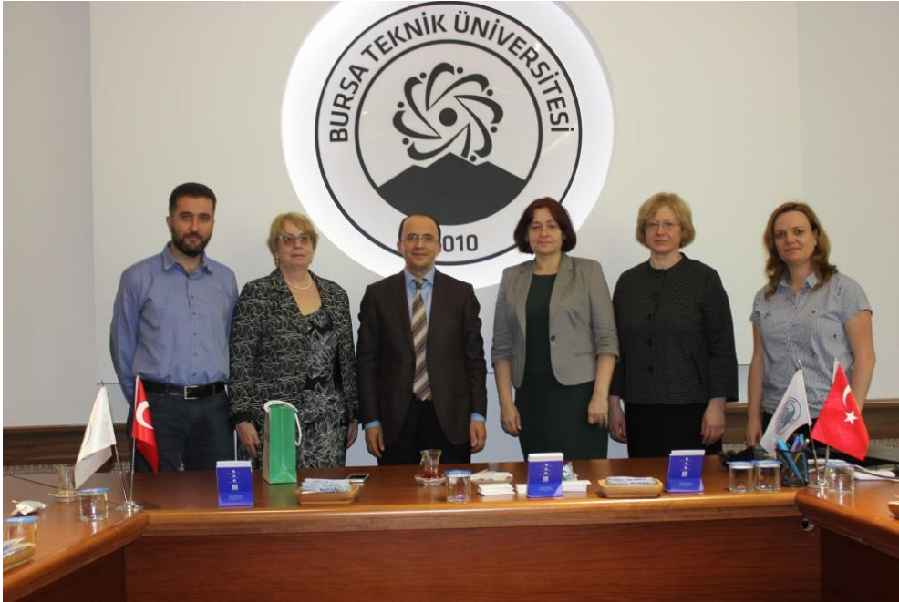
Letonya Ventspils Üniversitesinden 20.04.2018 tarihinde Üniversitemize yapılan ziyaretten bir görüntü.