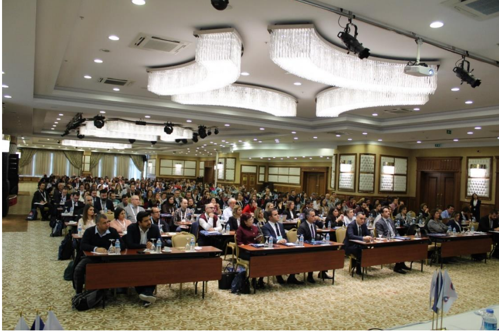
KA103 Proje Yönetim Toplantısı 3 Aralık 2018