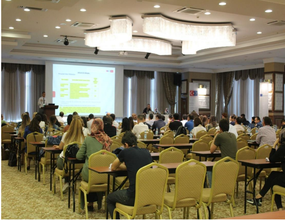
03.07.2018 KA 103 Toplantısı