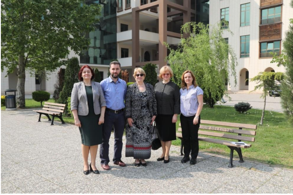
Letonya Ventspils Üniversitesinden 20.04.2018 tarihinde Üniversitemize yapılan ziyaretten bir görüntü.