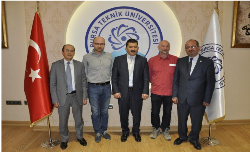
Fotoğraf 3. Lublin Teknoloji Üniversitesinin 31.03.2017 tarihinde Üniversitemize yapılan ziyaretten bir görüntü.