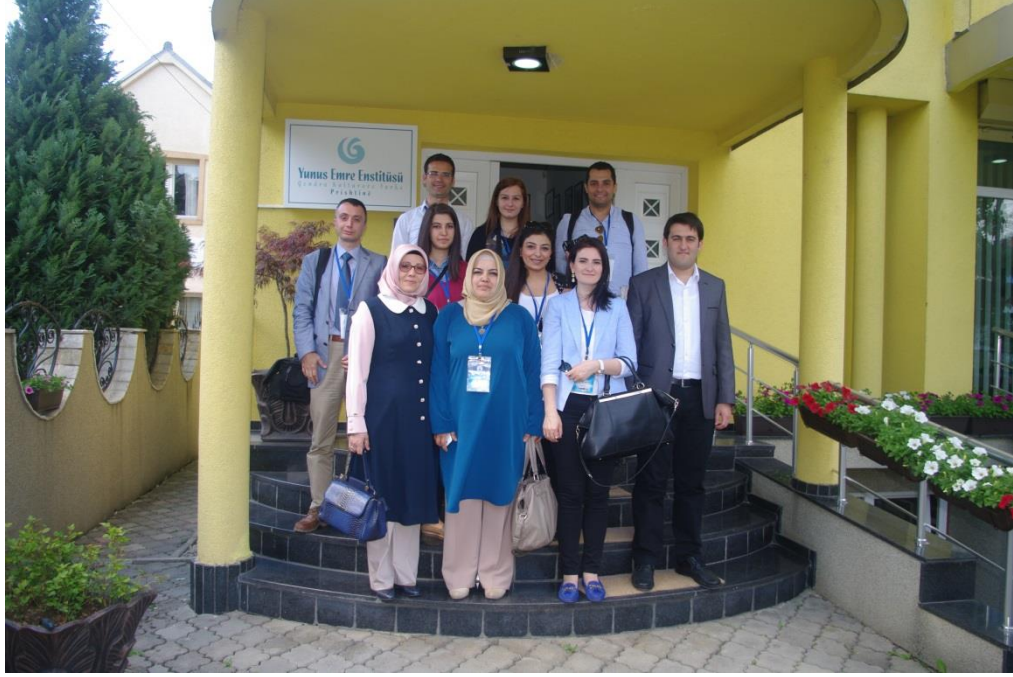
Fotoğraf 6. Yunus Emre Kültür Merkezi, Priştine ziyaretinden bir kare.

Karayolu ile gerçekleşen ziyaret programında, Yunanistan üzerinden Kosova-Arnavutluk-Makedonya güzergahı takip edilmiştir. Programın yoğunluğundan dolayı bazı ziyaretler eş zamanlı planlandığı için faaliyetler iki ayrı heyet tarafından yürütülmüştür. Üniversite, lise ve kurumsal ziyaretler olarak üç temel faaliyet olarak aşağıdaki sıralanan kurumlar ziyaret edilmiştir: