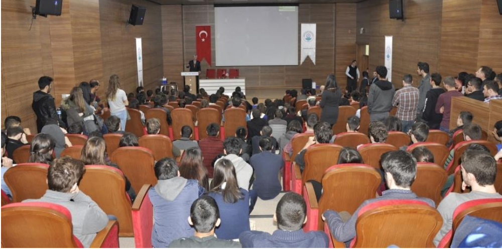
Fotoğraf 3. Amerika Birleşik Devletlerinde Yükseköğrenim Fırsatları Bilgilendirme Toplantısı