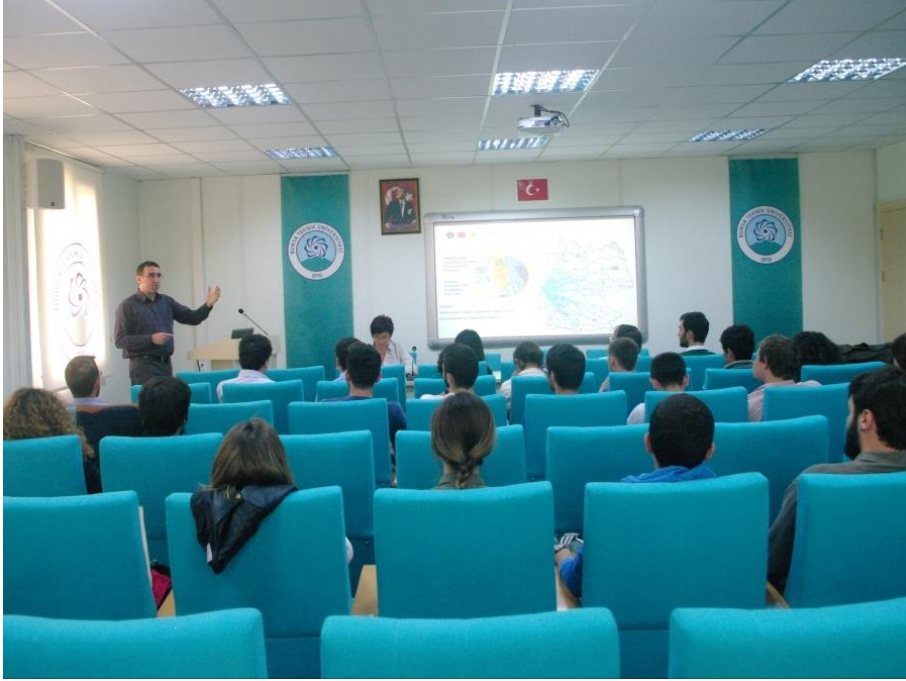
Fotoğraf 1. Almanya'da Yükseköğretim Burs Olanakları Bilgilendirme Toplantısı