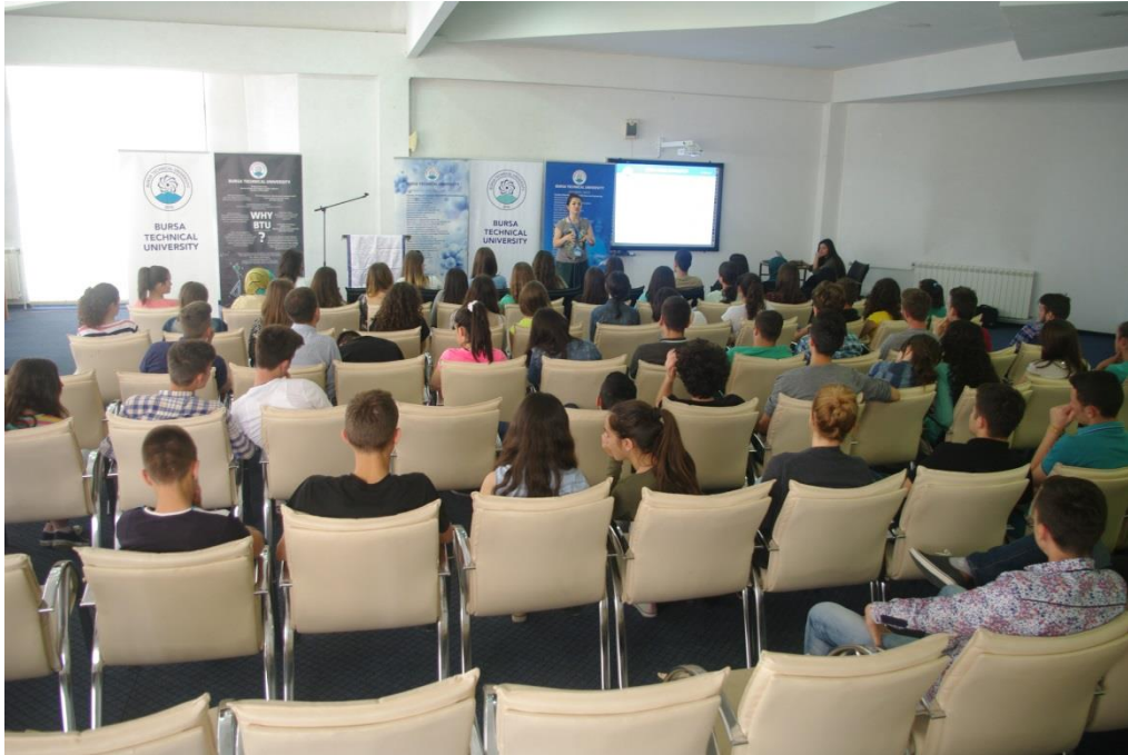
Fotoğraf 5. SHMQSH "Zef Lush Marku" Lisesi, Üsküp BTÜ tanıtımından bir görüntü.