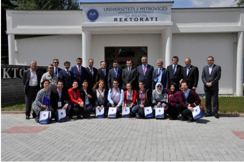
Fotoğraf 4. Mitrovica Devlet Üniversitesi "İsa Boletini" önünden heyet görüntüsü.