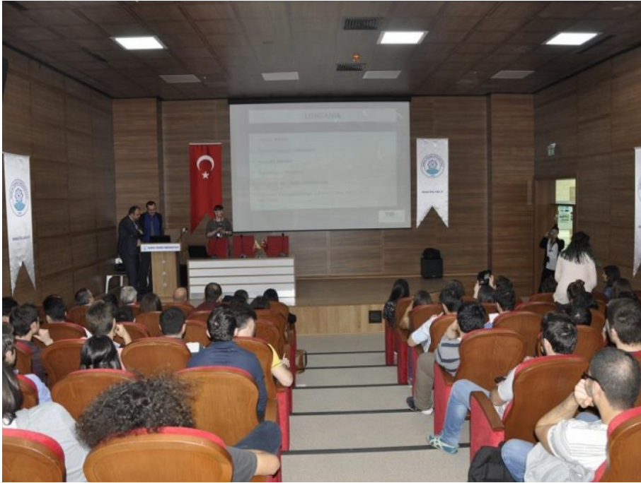
Fotoğraf 2. Litvanya'da Eğitim Olanakları Bilgilendirme Toplantısı